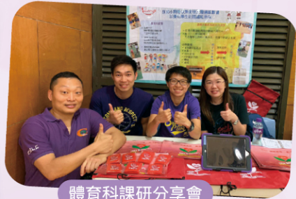
體育科課研分享會