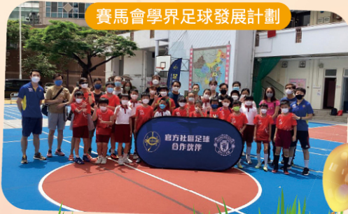
賽馬會學界足球發展計劃