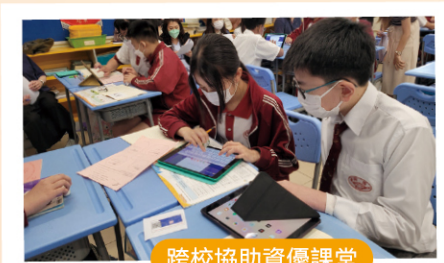
跨校協助資優課堂