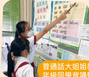
普通話大姐姐教導低年級同學背誦聲母表