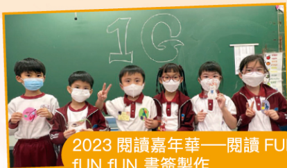
2023 閱讀嘉年華——閱讀 FUN FUN 書簽製作