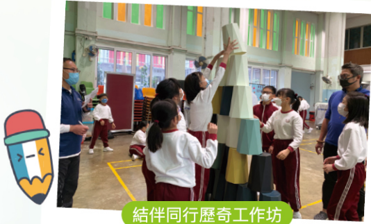
結伴同行歷史工作坊