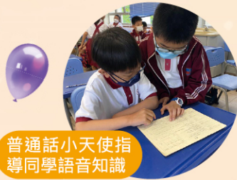
普通話小天使指導同學語音知識