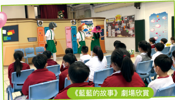
《藍藍的故事》劇場欣賞