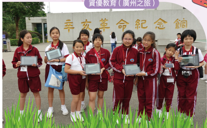
資優教育 (廣州之旅)