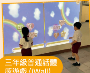
三年級普通話體感遊戲 (iWall)