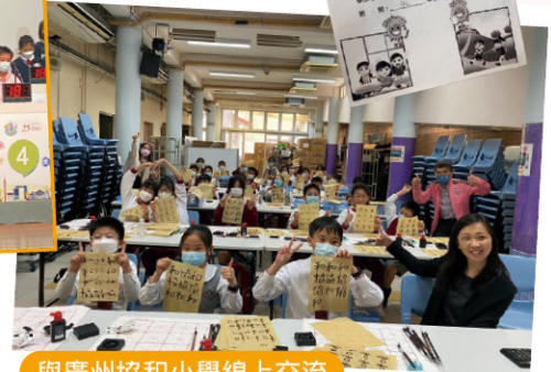
與廣州協和小學線上交流