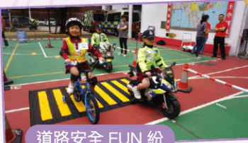
道路安全 FUN 紛