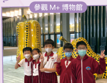
參觀 M+ 博物館