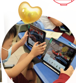
CoSpaces VR 計劃