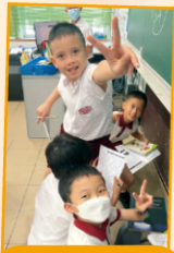
P4 Scavenger Hunt2