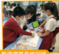
數理運算思維訓練