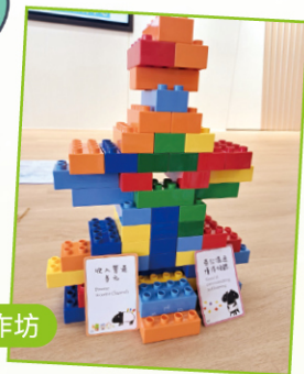
六色積木自我認識工作坊