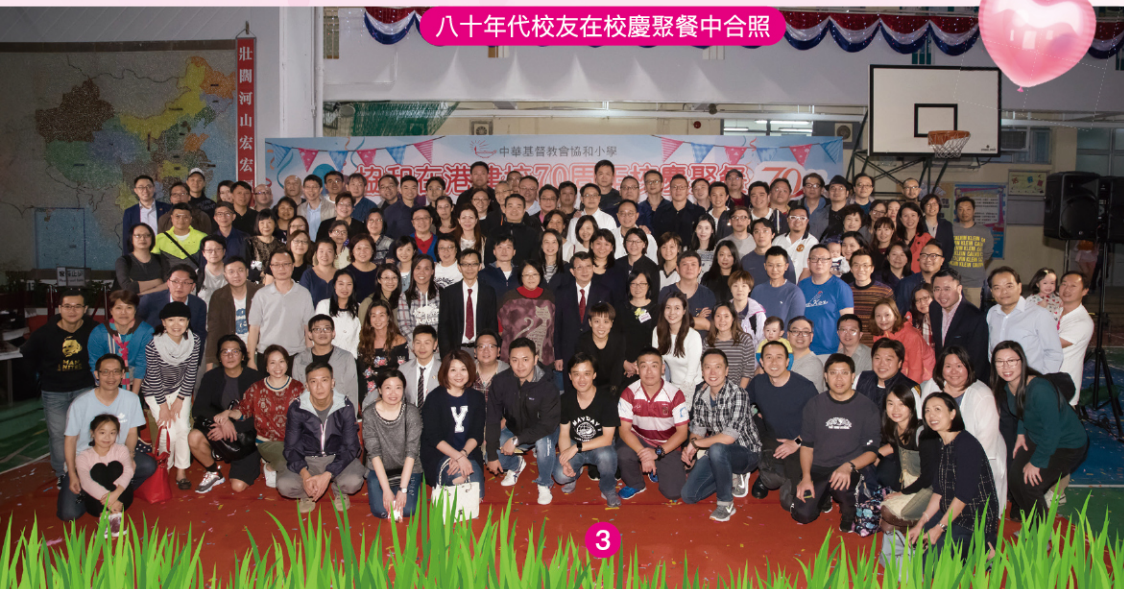
八十年代校友在校慶聚餐中合照