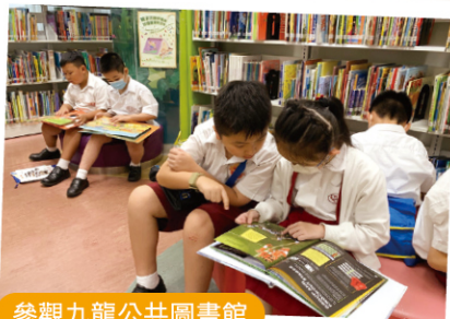
參觀九龍公共圖書館