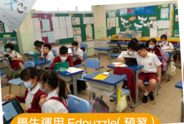
學生運用 Edpuzzle(預習)及 Padlet(延伸)輔助學習