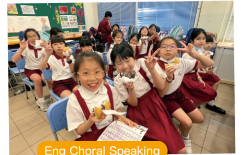
Eng Choral Speaking