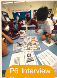
P6 Interview Practice