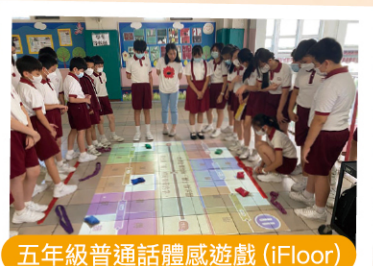
五年級普通話體感遊戲 (iFloor)