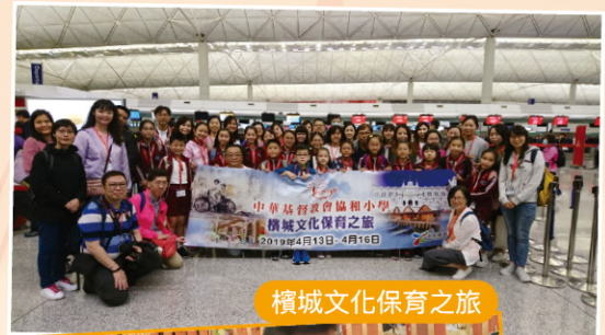
檳城文化保育之旅