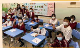
普通話小天使培訓工作坊