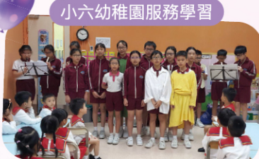
小六幼稚園服務學習