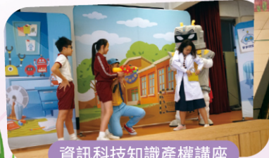
資訊科技知識產權講座