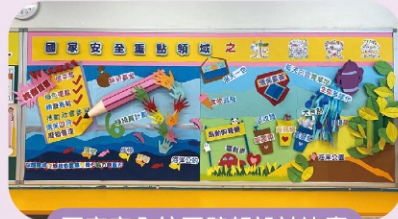
國家安全校園壁報設計比賽