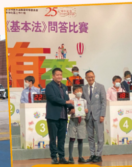
參加各類國民教育活動